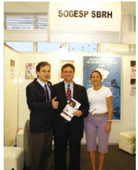
Presidente da SBRH visita estande SOGESP/SBRH

de um modo participativo, inteligente e eficaz”, completa.