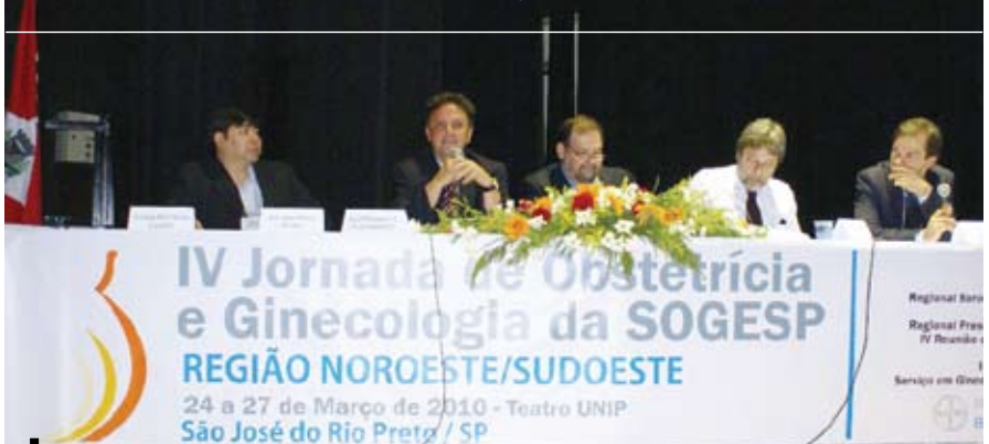
Mesa diretiva do evento

Dentre os participantes, 85 figuram entre os mais renovados professores do Brasil. Evento contou pontos ao Certificado de Atualização Profissional