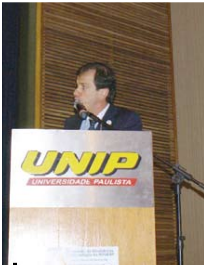
Discurso de abertura