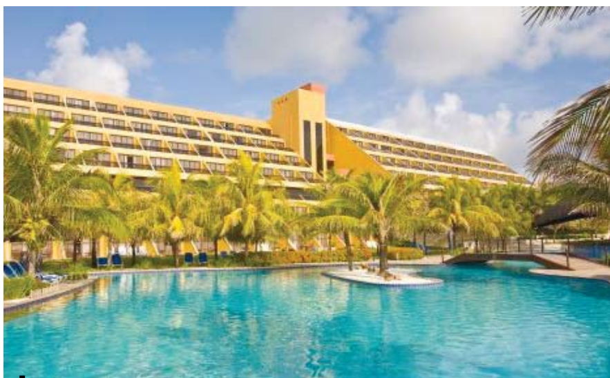
Hotel Pestana, palco do simpósio

Evento permitirá intercâmbio de informações entre especialistas brasileiros, franceses, italianos e espanhóis