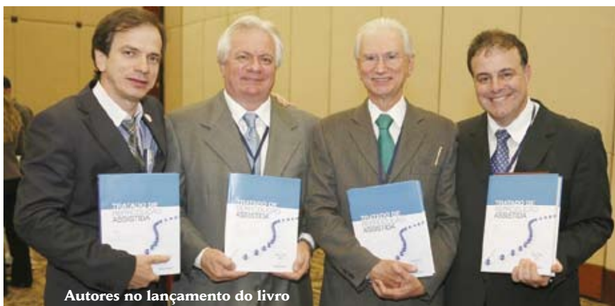
Autores no lançamento do livro

Obra consumiu um ano em pesquisa e reuniu mais de 180 profissionais das principais cidades do Brasil